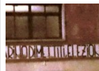
Per una Decina che... dorme, altri sono svegli!