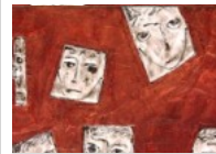
Grecia, possibili attentati? Tsipras, UE, soldi