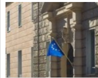
UE: arrivano le bandiere finte! A Roma