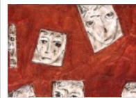
Il Cocorico' e la strada aperta in Sicilia. Le Italie da preferire